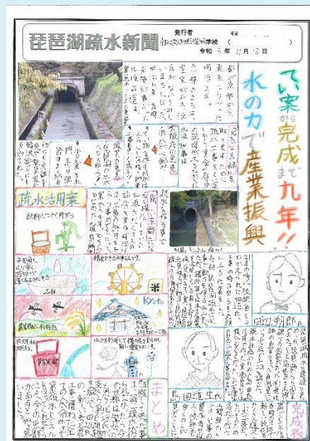
< A 部門(新聞)の例 >

入賞結果については、ミニ絵本『びわ湖疏水探究紀行』に掲載します。(作品を掲載・展示する場合は、入選のお知らせとともに連絡させていただきます。)